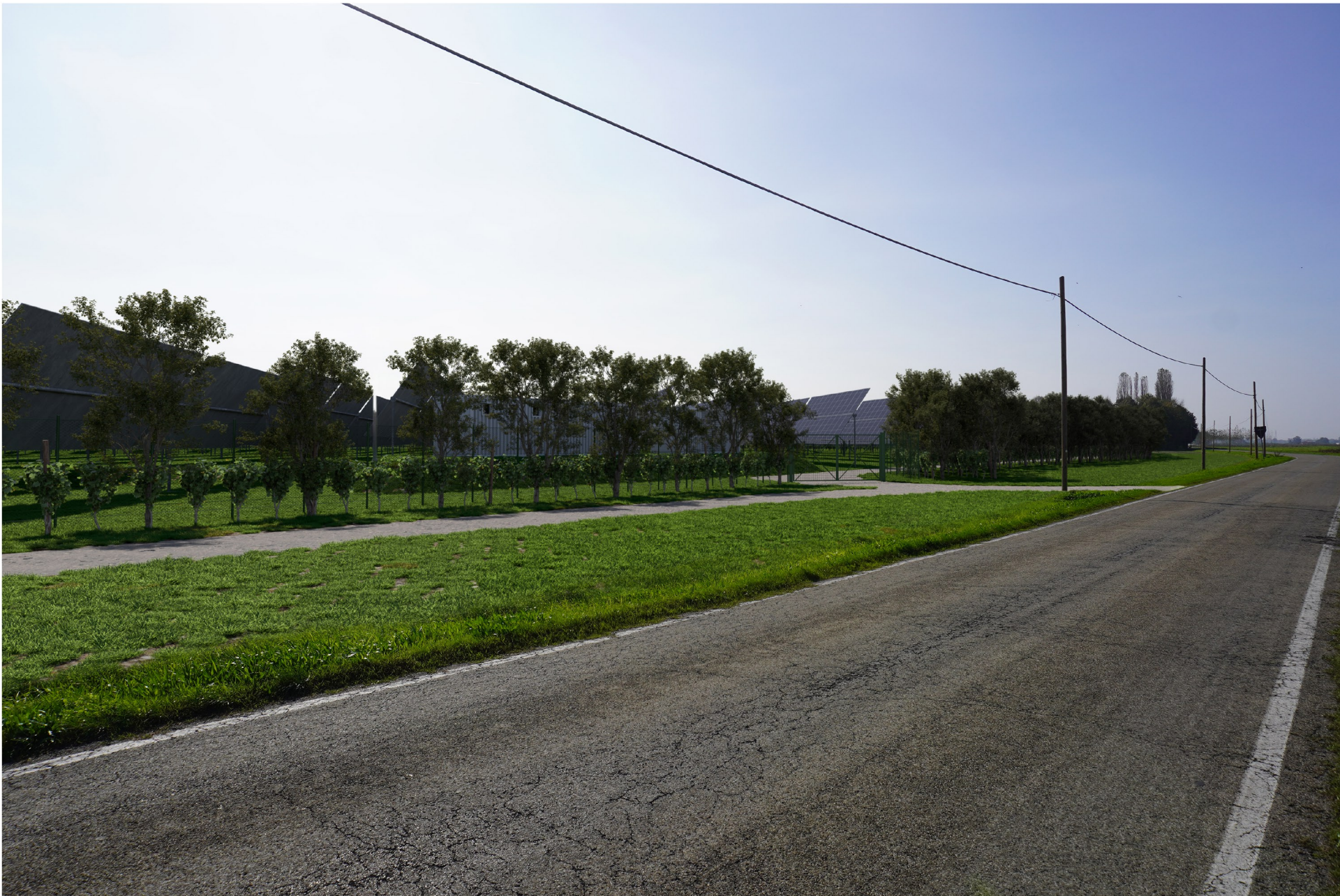
Fotoinserimento n.1 - Stato di progetto mitigato