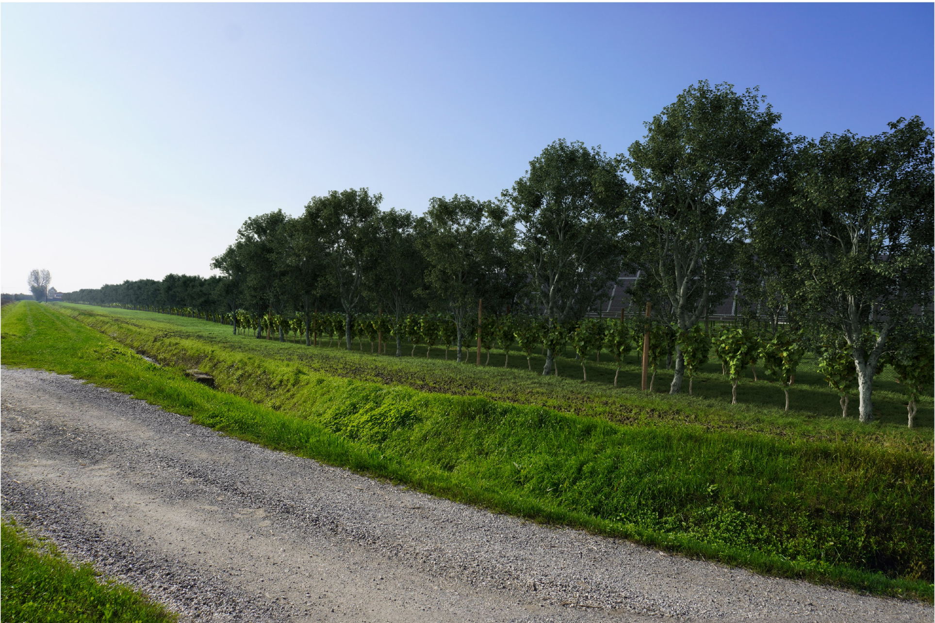
Fotoinserimento n.3 - Stato di progetto mitigato