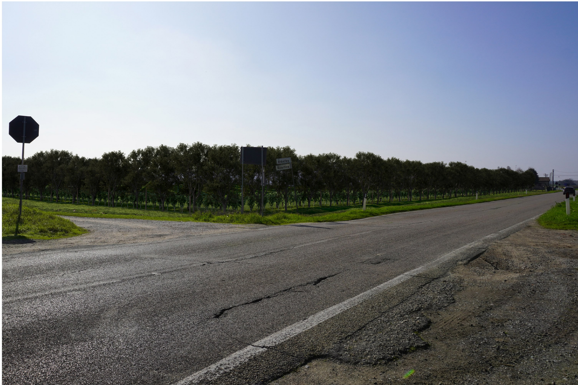
Fotoinserimento n.2 - Stato di progetto mitigato